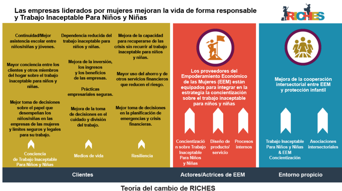
Figura 2: caja de herramientas RICHES Teoría del cambio

Es importante señalar que muchos proyectos que abordan el trabajo inaceptable para niños y niñas (trabajo infantil) incluyen una encuesta infantil para evaluar la probabilidad de trabajo inaceptable para niños y niñas en su área de servicio/proyecto, pero dicha herramienta no se incluye en esta caja de herramientas. Sin embargo, cuando las intervenciones se dirigen directamente a los niños y niñas, se pueden encontrar orientaciones adicionales, muestreos y ejemplos de encuestas a nivel infantil en recursos como Publicación del U.S. Department of Labor titulada Resources for Quantitative Surveys on Child Labour y una publicación de la Organización Internacional del Trabajo titulada Child Labour Statistics: manual de metodologías para la recolección de datos a través de encuestas .