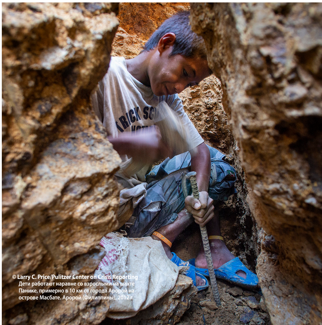
Дети работают наравне со взрослыми на шахте Панике, примерно в 10 км от города Аророй на острове Масбате, Аророй (Филиппины), 2012 г.