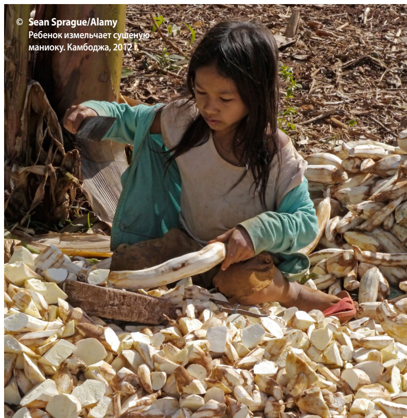
Ребенок измельчает сушеную маниоку. Камбоджа, 2012 г.

предоставления основных социальных гарантий, эти организации поддерживают борьбу за устойчивое решение этих проблем. ILAB выступает за свободу работников и их право открыто заявлять о возникающих на рабочем месте проблемах. В порядке постоянного взаимодействия Бюро добивается предоставления работникам возможности сообщать о том, что происходит в их организации и в цепочках поставок, и стремится стимулировать работодателей к взаимодействию с работниками в отношении условий труда и надлежащему информированию как работников, так и руководства относительно прав, обязанностей и механизмов рассмотрения жалоб.