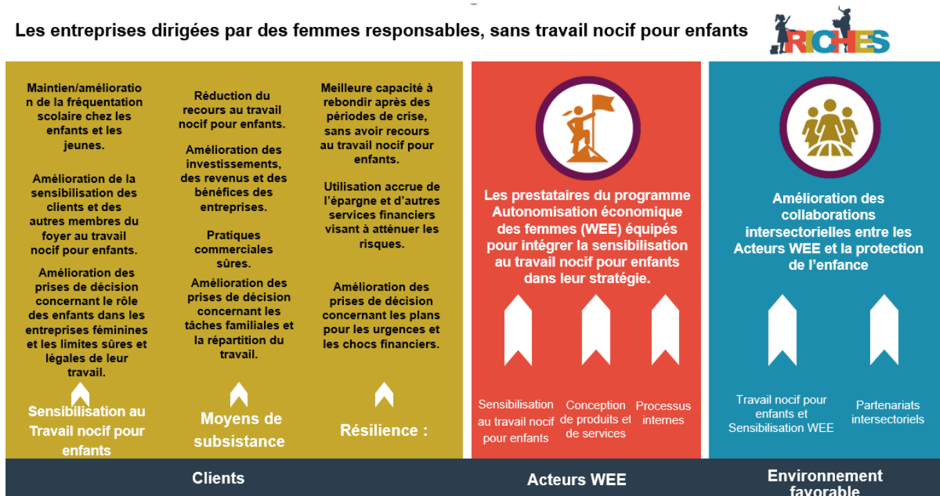
Figure 2 : Théorie du changement de la boîte à outils RICHES

Contexte : Cet outil est conçu pour l'évaluation des changements dans les connaissances, les attitudes et les comportements à court terme ainsi que les résultats de ceux qui participent au programme Entreprise à Risque du projet RICHES et/ou d'autres activités associées. par les équipes de recherche et d'évaluation afin Sans être exhaustifs, les principaux résultats qui sont présentés dans la théorie du changement de RICHES (Figure 2) sont mentionnés dans l'instrument d'enquête.