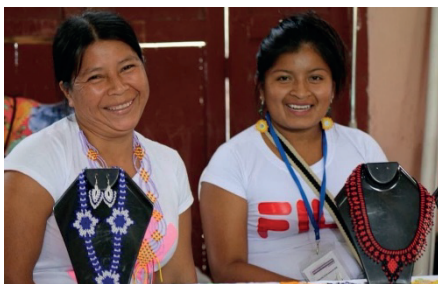
Artesanías Embera en Segovia, Antioquia