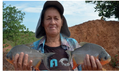
Piscicultura de cachama en el Bajo Cauca.