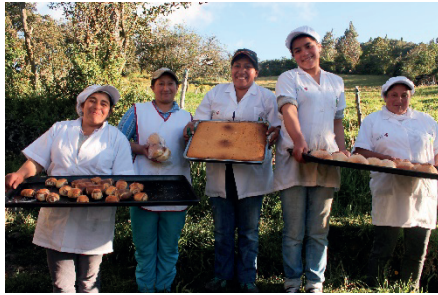
Panadería de almidón de papa en Boyacá.

Pact impulsa proyectos productivos con un enfoque de desarrollo de capacidades, que ejecuta de la mano del SENA en Antioquia y la caja de compensación familiar Comfaboy en Boyacá. Algunos son: