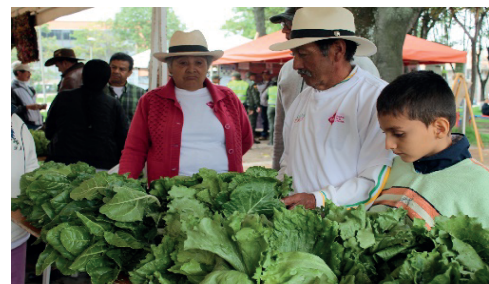
Huertas comunitarias en Boyacá y Antioquia.