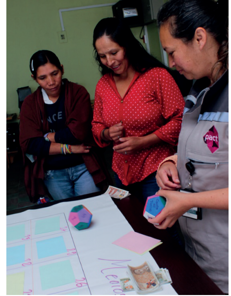
Taller de Economía Familiar, Boyacá.

956 certificados en cursos técnicos a adolescentes entre 15 y 17 años.